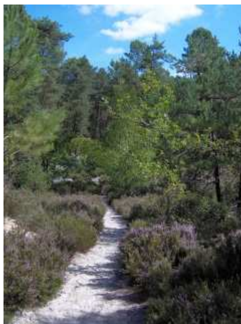
Le GR13 en forêt de la Commanderie

Atteindre le village de Puiset en passant par le chaos rocheux du mont