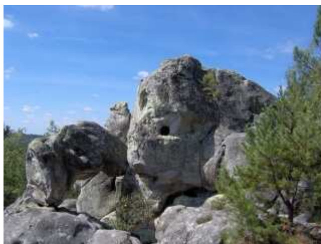
Chaos rocheux du Monoury