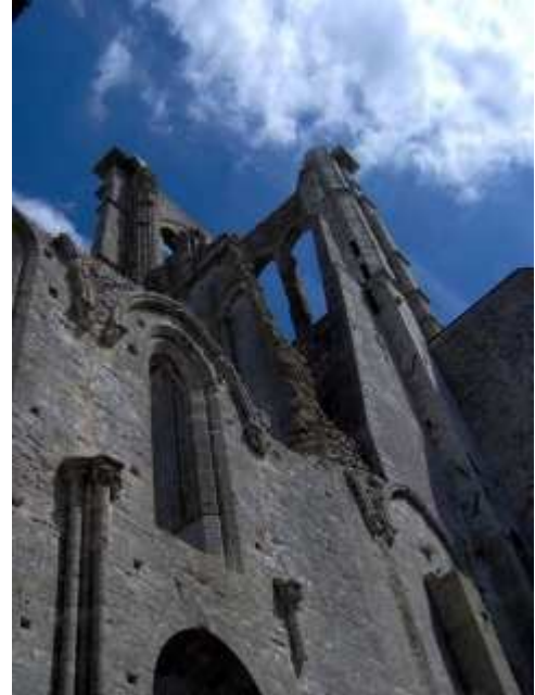
Tour de la basilique de Larchant