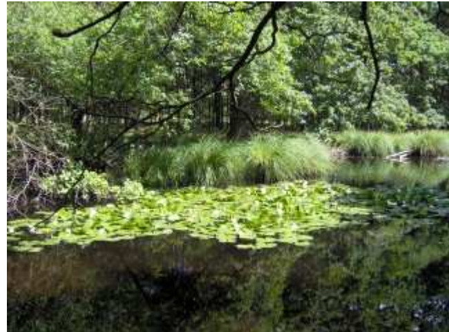
forêt de Sénart