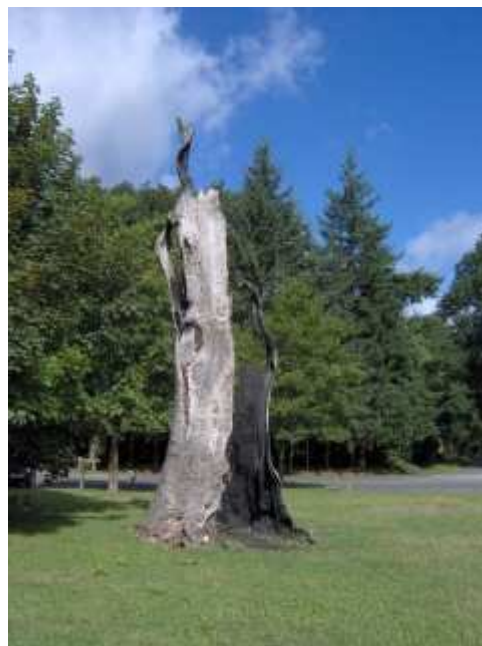
forêt de Sénart: chêne d'Antin

Au carrefour de Montgeron, il est possible de délaissé le GRP pour se diriger à droite vers l'étang du carrefour du Rut (non balisé) et de le retrouver au carrefour des Nymphes