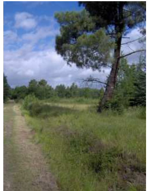
forêt de Sénart