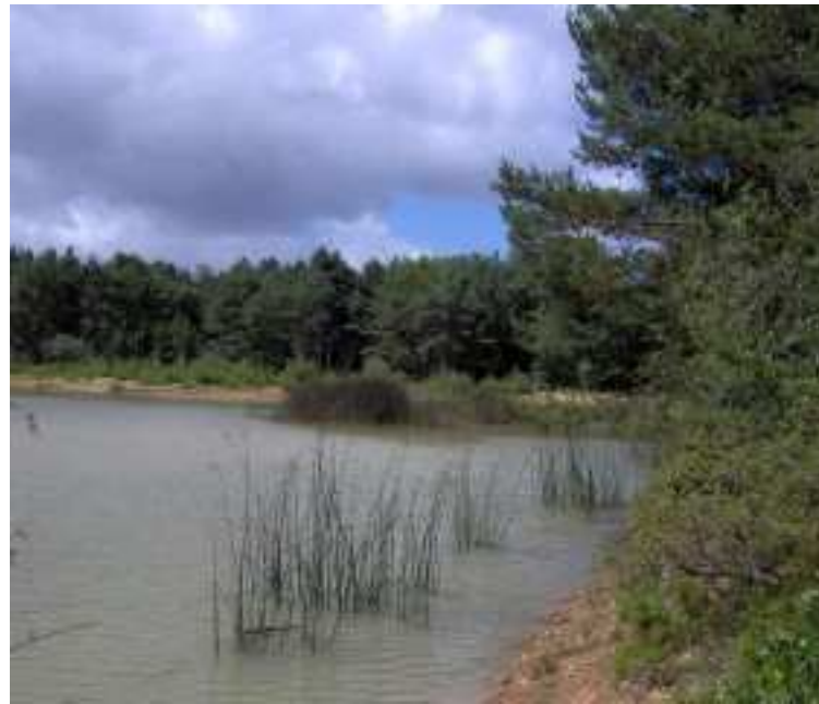
forêt de Sénart, étang du carrefour du Rut

Après le viaduc de la voie ferrée, une courte montée vous mène à la gare de Brunoy.