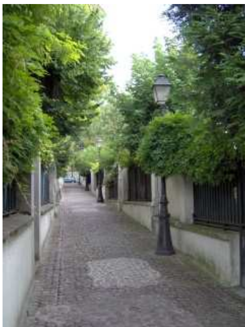
Villa de Belleville