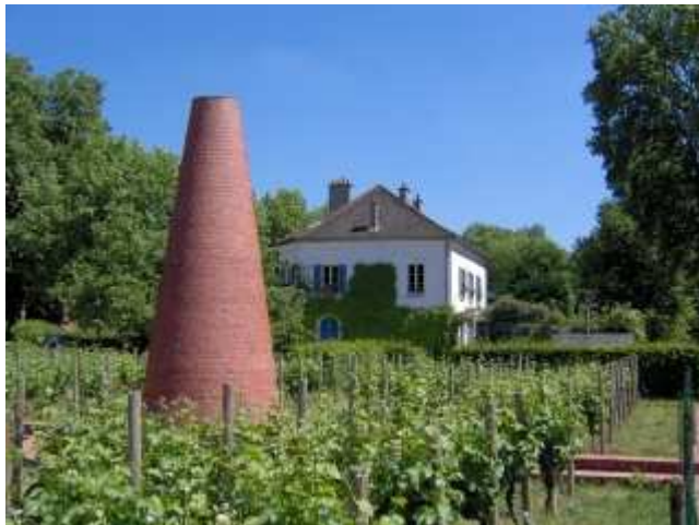
Vignes du parc de Bercy