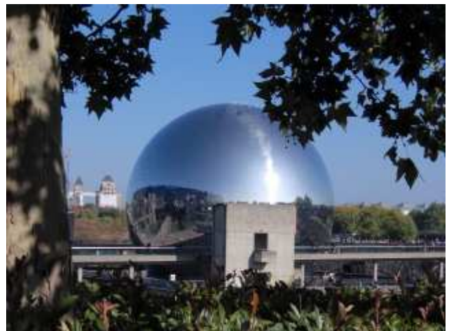
La Géode, parc de La Villette