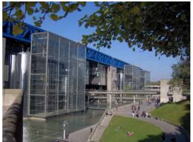
Cité des Sciences de La Villette

Celle-ci nous amènera dans le parc de Bercy que nous traverserons sur toute sa longueur pour atteindre le cours Saint-Emilion, terme de cette balade.