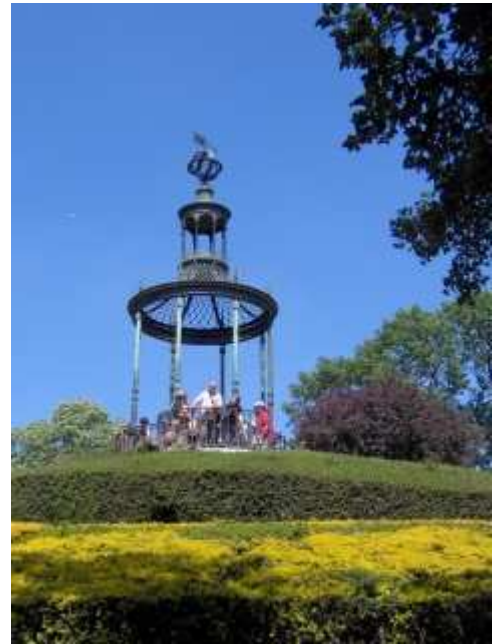
Belvédère du jardin des plantes